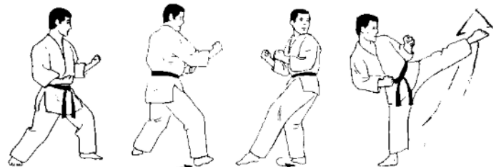
Ushiro Mawashi Geri