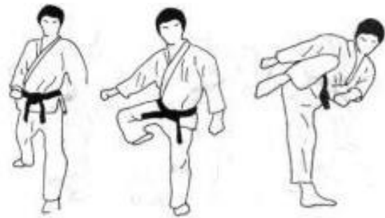
Hiza Geri (Mawashi)